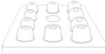
ถาดใส่ที่หุ้มหูฟัง